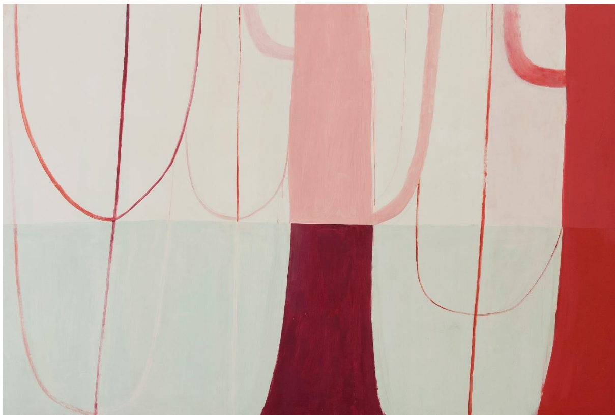
Bosque, 2019 Acrílico sobre lienzo 160 x 240 cm